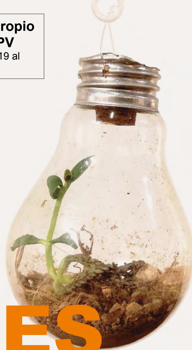
Imagen Marco Ramieri, Diseño Adrián Beltrán, Producción José Albelda y Celia Puerto, Universitat Politècnica de València.